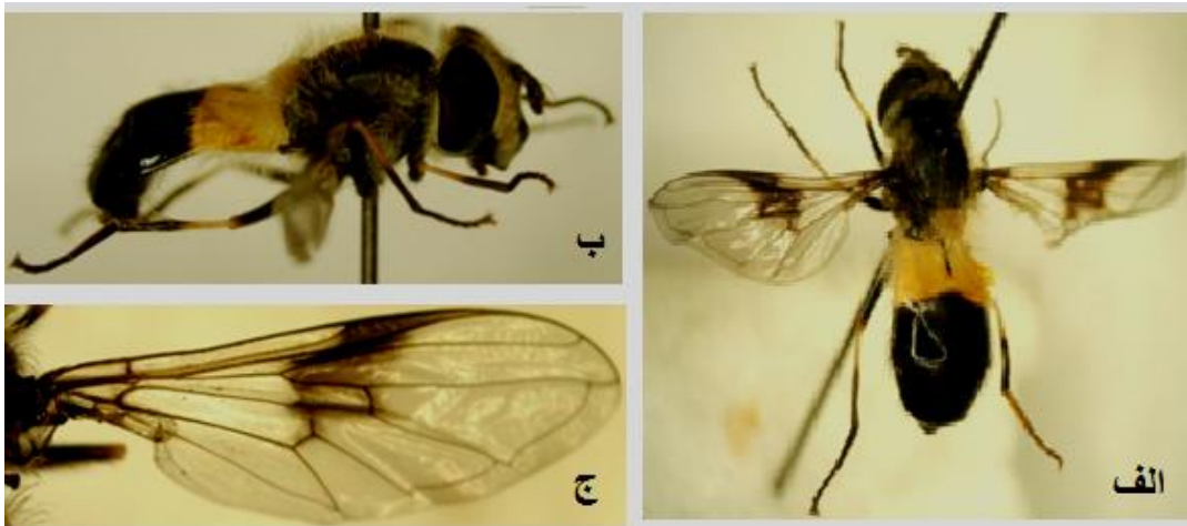
شکل 2- گونه Leucozona lucorum (الف) جنس ماده از سطح پشتی، (ب) جنس ماده از سطح پهلوئی، (ج) بال (اصلی).

شکل شناسی: چشم‌ها با موهای انبوه مشخص به رنگ تیره و خاکستری، سلول استیگمای بال و قسمت پایینی آن کاملاً ابری یا تیره، سپرچه زردرنگ، حاشیه کناری صورت زردرنگ، بال به طول 7.75 - 10 میلی- متر، ترژیت 2 به رنگ سفید یا زرد روشن، وجود