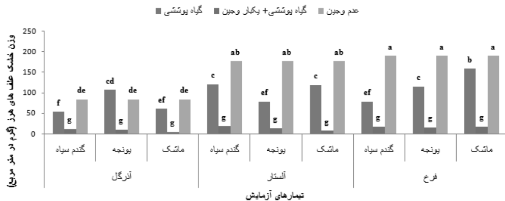
شکل 3- وزن خشک علف‌های هرز در تیمارهای کنترل علف هرز برای ارقام آفتابگردان

بود. گندم سیاه در ایجاد کنوپی سریع‌تر از علف‌های هرز و گیاه زراعی عمل کرد و با داشتن شاخص سطح برگ بالا در رقابت برای جذب نور از گیاهان مجاور پیشی گرفته و بواسطه سایه اندازی و خواص آللوپاتیک از رشد علف‌های هرز جلوگیری نمود.