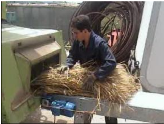
شکل 4- نحوه ی تغذیه مواد به نقاله تغذیه کمباین

نقاله تغذیه و به دنبال آن به فضای کوبنده و ضدکوبنده تغذیه می گردید (شکل 4).