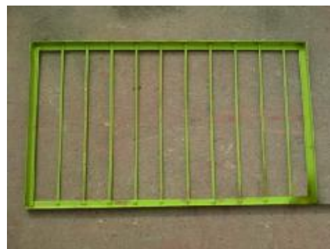
شکل 2- سینی شبکه بندی

آذربایجان، استفاده گردید. در این طرح ابتدا اندام‌های مربوط به هد، کاه پران، چنگک هم‌زن، دمنده، الک‌ها و ماردم‌های مربوط به دانه تمیز و کزل، با توجه به عدم نیاز در این آزمایش‌ها، از روی کمباین برداشته شد و سپس یک عدد سینی شبکه بندی شده در ابعاد 1050 \times 610 میلیمتر برای سنجش میزان جداسازی دانه از نقاط مختلف ضد کوبنده ساخت شد (شکل 2).