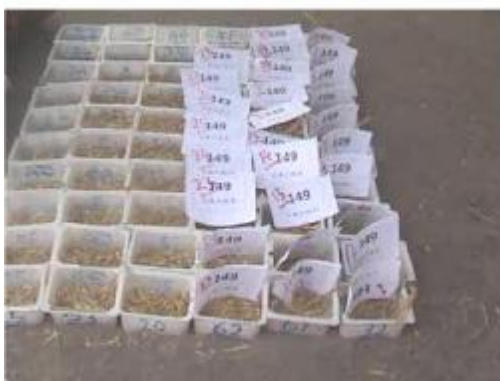
شکل 5- نحوه ثبت مواد دانه‌ای جدا شده در کوبنده و

بعد از هر آزمایش، دانه‌های آزاد (کوبیده شده) منتقل شده به قسمت غربال که همراه با مواد غیر دانه‌ای (MOG) از عقب کمباین روی پارچه‌ی پهن شده روی زمین می ریخت، توسط الک هایی به صورت دستی جدا و با ثبت شماره آزمایش، توسط ترازوی دیجیتالی با حساسیت 0/01 گرم وزن و یادداشت می شد. مواد داخل سلول ها نیز پس از ثبت شماره آزمایش و شماره سلول، به داخل کیسه های کوچک خالی شده و پس از جداسازی از مواد غیردانه‌ای رد شده از سوراخ های ضدکوبنده، توسط یک ترازوی دیجیتالی حساس توزین و یادداشت شد. نمونه‌ای از نحوه‌ی ثبت مواد دانه‌ای جدا شده در کوبنده و ریخته شده در داخل سلول ها در شکل 5 نشان داده شده است.