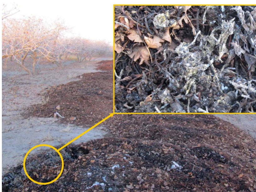
شکل ۱- ایجاد کلونی قارچ‌های گندرو در پسماند پسته

بار آبیاری شدند. جهت تهیه نمونه شاهد، از خاک سایر قسمت‌های باغ که فاقد هرگونه پسماند، کود شیمیایی و یا کود دامی طی دو سال متوالی بود، استفاده گردید.